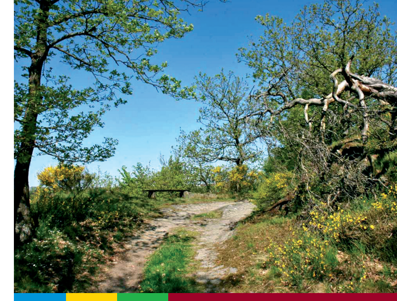
Panzerspuren an der „Decke- Ley“

Führung stand jedoch fest, dass ein amerikanischer Angriff auf Schmidt nur dieses eine Ziel haben könnte. Daher setzte Generalfeldmarschall Model, Oberbefehlshaber der Heeresgruppe B und just zu diesem Zeitpunkt mit allen wichtigen Kommandeuren bei einer Planübung auf Gut Schlenderhahn bei Bergheim, alle verfügbaren Truppen ein, darunter die gerade nach der Kapitulation aus Aachen abgezogene 116. Panzerdivision, um den Vormarsch zu stoppen.