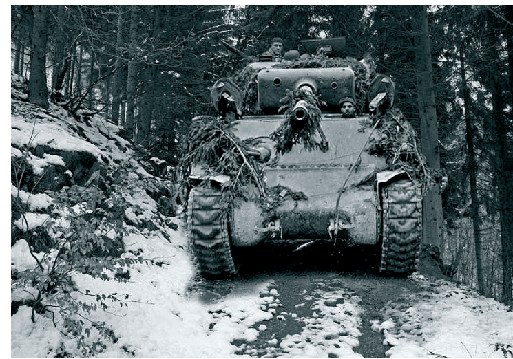
Sherman-Panzer auf dem Kall Trail

Meinung der alliierten Führung kein deutscher Angriff möglich sei: in die Ardennen. Nur wenige Wochen später wurde sie dort bei der deutschen Gegenoffensive fast völlig zerschlagen.