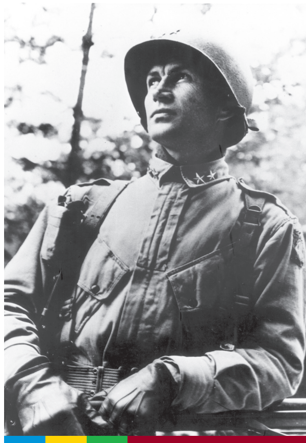
James Gavin

Glückwünsche trafen von überall her ein, doch in Wirklichkeit verdüsterte sich die Gesamtlage dramatisch. Teile der deutschen 116. Panzerdivision und der 89. Infanterie Division begannen nun, die zwei amerikanischen Bataillone in Schmidt und Kommerscheidt anzu-