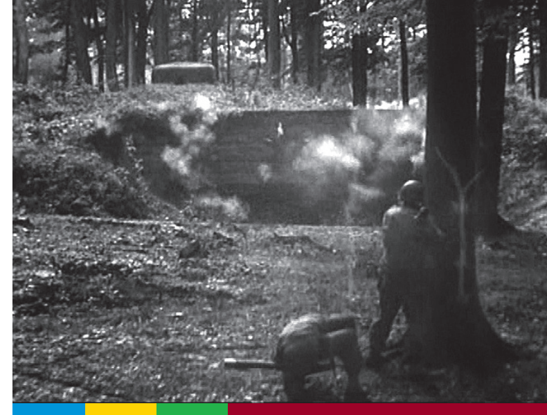
Bunkerkämpfe im Herbst 1944

Die gewohnte Unterstützung, die den schnellen Vormarsch durch Frankreich und Belgien erst ermöglicht hatte, blieb jedoch oft aus. Panzer konnten über die unwegsamen Waldwege und Feuerschneisen nur müh-