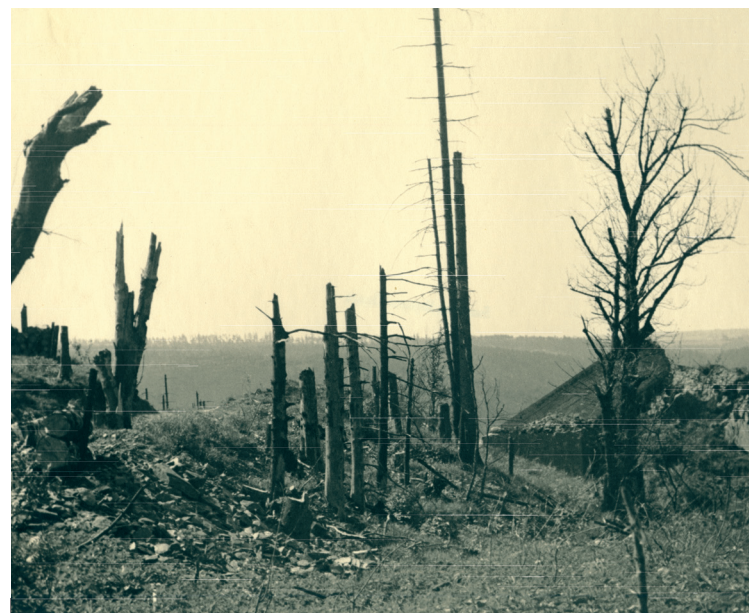
Gesprengte Bunker 1947

vorne verlief. Jede deutsche Kompanie, jedes Regiment konnte sich so in den unübersichtlichen Wäldern an eine Mauer aus Beton anlehnen. Was folgte, war ein monatelanger Stellungskrieg, der an die Kriegsführung des Ersten Weltkriegs erinnerte. Erst nach dem Zusammenbruch der deutschen Gegenoffensive in den Ardennen gelang es der 1. US-Armee im Februar 1945, das Kalltal und die zweite Bunkerlinie im Hürtgenwald zu überwinden.