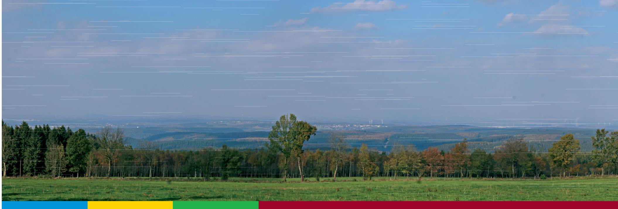
Panorama vom „Eifel-Blick“ Jägerhaus

Eine der entscheidenden Fragen bis heute ist, welche Rolle der Westwall im Herbst 1944 wirklich spielte. Tatsache ist, dass die in den 1930er-Jahren gebauten Bunker für die sich rasant weiter entwickelte Waffentechnik nicht mehr brauchbar waren, so dass zum Beispiel das MG 42 aufgrund der Gasführung nicht in die für die Vorgängermodelle konstruierten Scharten passte. Ähnlich war es bei den Panzerabwehrgeschützen, deren Kaliber im Laufe der Jahre immer größer geworden waren. Nun aber lagen die Westwallbunker im Bereich der Nordeifel