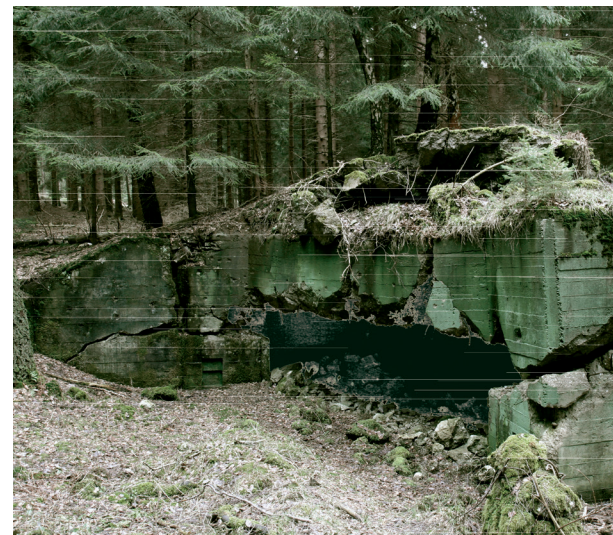
Bunker 107

Auch die „Heimatfront“ wurde nun mobilisiert und militarisiert: Im Gau Köln-Aachen wurden ca. 50.000 Männer, Frauen und Hitlerjungen zum Schanzens an die Westgrenze abkommandiert, auch Zwangsarbeiter und Kriegsgefangene wurden dazu eingesetzt. Parallel dazu kam es in der Region durch Räumkommandos der